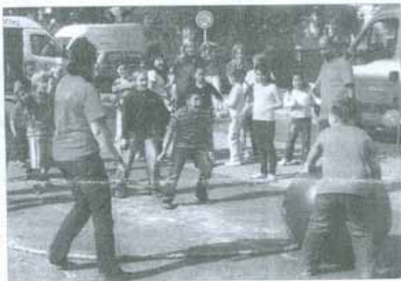
Spiel und Spaß versprechen die mobilen Aktionen des Vereins Spielteufel mit dem Spielmobil und der Spielmobilarawane.

Am Donnerstag, dem 23. Juli, um 13 Uhr kommt die Spielmobilarawane erstmals in den Eilbeker Bürgerpark. Unter dem Motto „Drachenland“ gibt es spannende Minischaubühnen wie „Die Jagd nach dem Drachengold“, Drachenszenarien, Drachenspielerprüfungen und ein Drachenspektakel. Außerdem können die Besucher im Märchenland Lieder und Geschichten hören und Drachenzettel lernen. Abenteuerlustige Kinder, Jugendliche und erwachsene Begleiter sind willkommen. Der Eintritt ist frei! Auch der Eilbeker Jugendtreff beteiligt sich an der Ferienaktion mit sportlichen Angeboten für Jugendliche. Am Dienstag, dem 21. Juli, treffen sich inter-