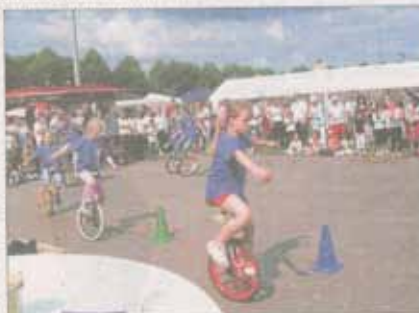
Wie im vergangenen Jahr, können sich Besucher des Stellingen Festes auch diesmal wieder auf zahlreiche bunte Attraktionen und Vorführungen freuen.

Das Stadtteilfest hat sich von seinen eher kleinen Anfängen auf dem Parkplatz hinter dem Stellingener Rathaus am Bauseweg zu dem Stellingener Ereignis des Jahres entwickelt. Eine der Hauptattraktionen des Festes ist in diesem Jahr die Hebebühne, mit der man sich Stellingen aus 70 Metern Höhe anschauen kann. Die Freiwillige Feuerwehr präsentiert sich Besuchern mit Vorführungen. Auch für Kinder gibt es wieder viel zu erleben. Mit Kinderschulern, Trampolinspringen, der Kindersesselschaukel, einer Schiffschaukel, Dosen- und Pfeilwerfen kommen kleine Festbesucher voll auf ihre Kosten und werden garantiert viel Spaß haben.