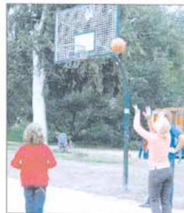
Der neue Streetballplatz im Eilbeker Bürgerpark wurde von den Jugendlichen eingeweiht.

Jeden Mittwoch in der Zeit von 14 bis 16 Uhr ist zudem der Sportplatz mit einem Bus voller mobiler Spielgeräte von C&C, Altes Kinder- und Jugendliche, die Lust auf Spiel und Sport haben, sind im Bürgerpark gesammelt.