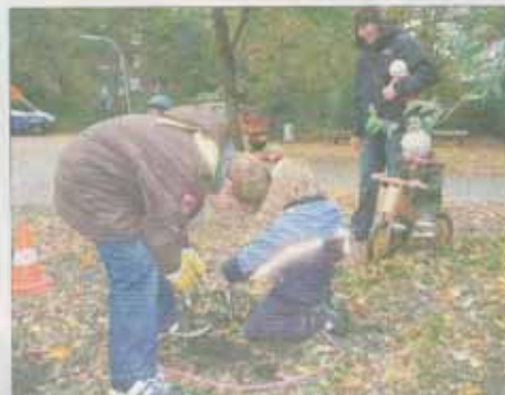
Kinder setzen Blumenzwiebeln im Eilbeker Bürgerpark.

Spielplatz-Check in den Bürgerpark geladen hatte. Nur schwer waren die Kinder bei schönem Herbstwetter vom Spielplatz an den Konferenztisch zu locken. Dennoch zog eine Handvoll Nachwuchsaktivisten Bilanz: „Das dauert alles ganz schön lange. Und außerdem sind die Drehscheibe und die Kindersitze verschwunden“, beklagten sich die Kinder bei den Vertretern aus dem Bezirksamt. Rainar Iselt aus der Abteilung Management des öffentlichen